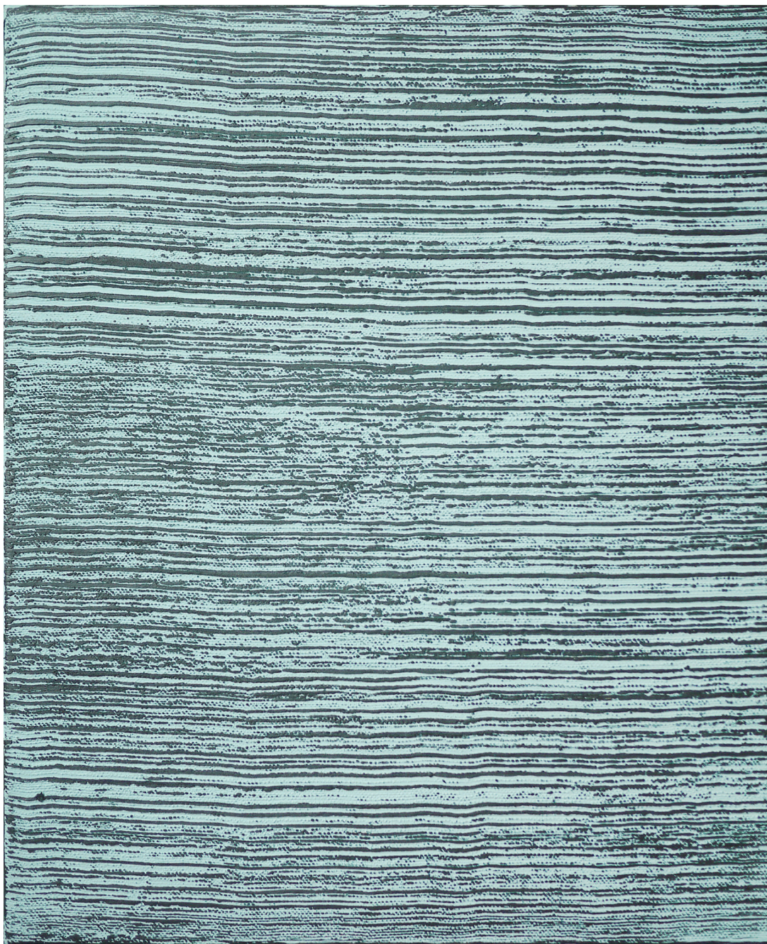
Série Matières Matière paysage Acrylique et médium sur toile 65x53 cm 2016 © Lee Eu