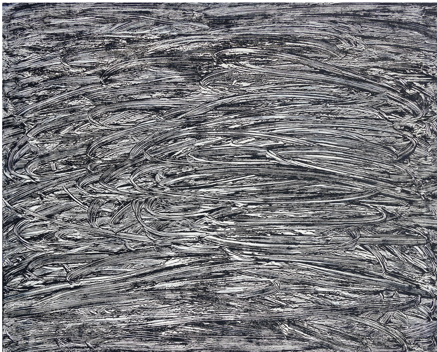
Série Matières Matière paysage Acrylique et médium sur toile 130x96 cm 2016 © Lee Eu