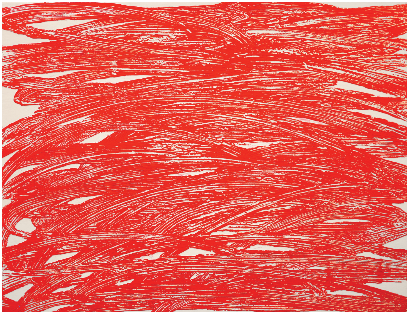
Série Matières Matière paysage Acrylique et médium sur toile 116 x 89 cm 2016 © Lee Eu