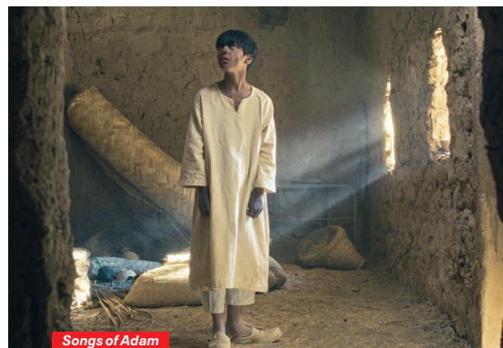
Songs of Adam

Mostra de Venise 2023 (section Orizonti)